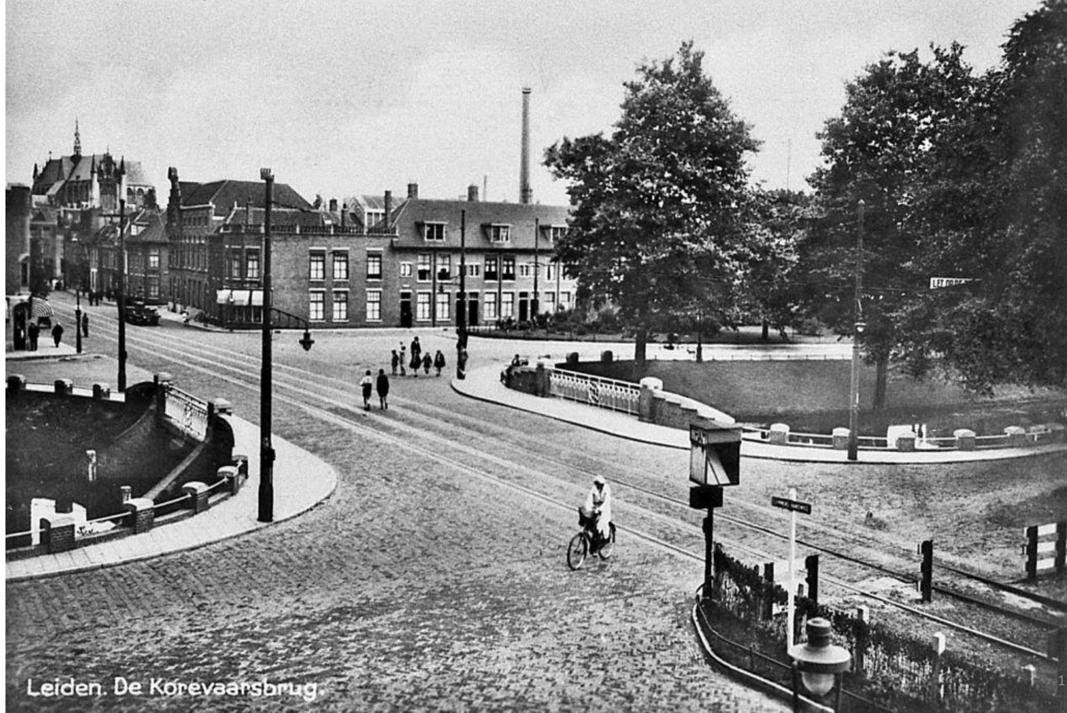
Leiden. De Korevaarsbrug.