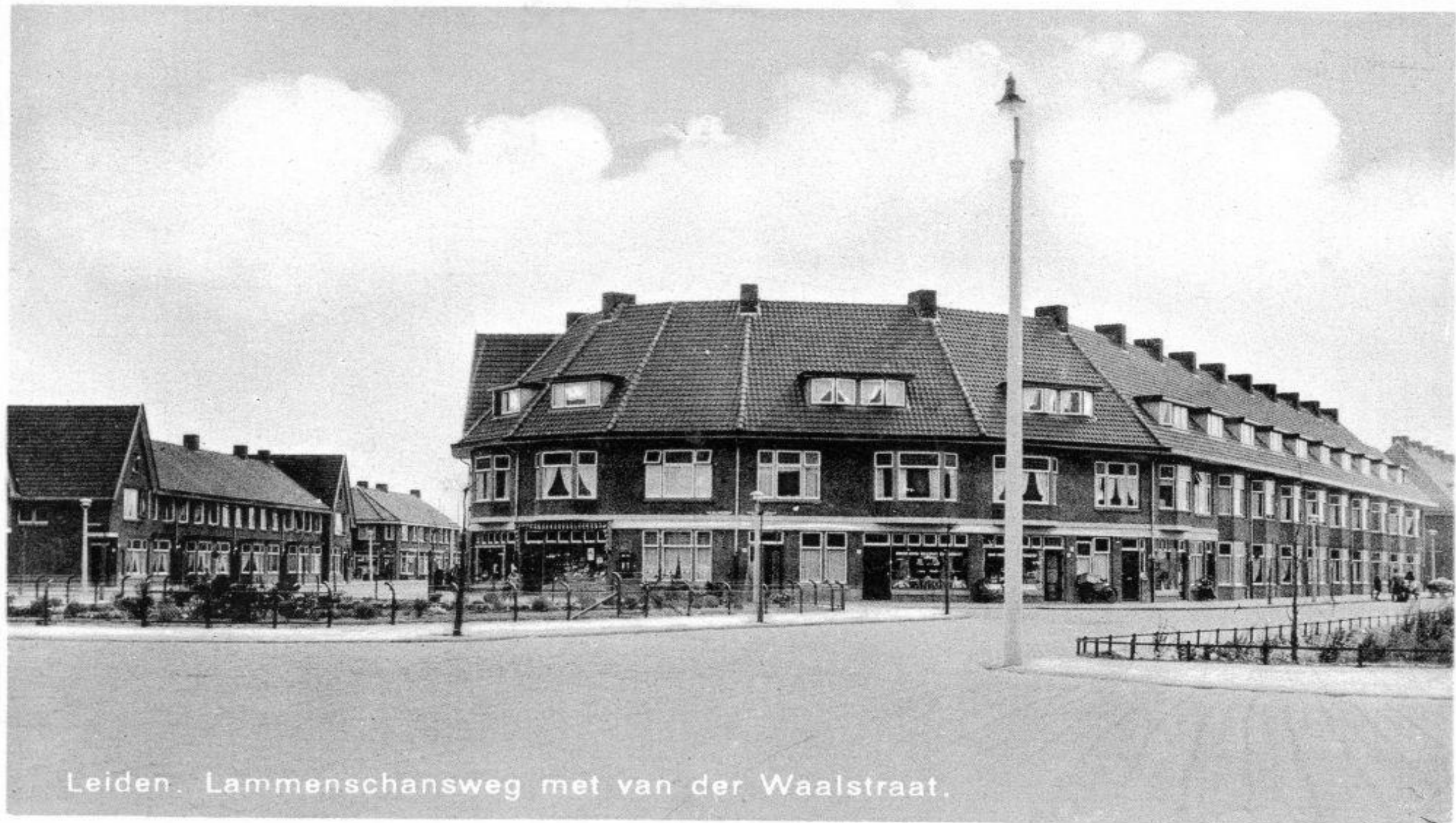
Leiden. Lammenschansweg met van der Waalstraat.