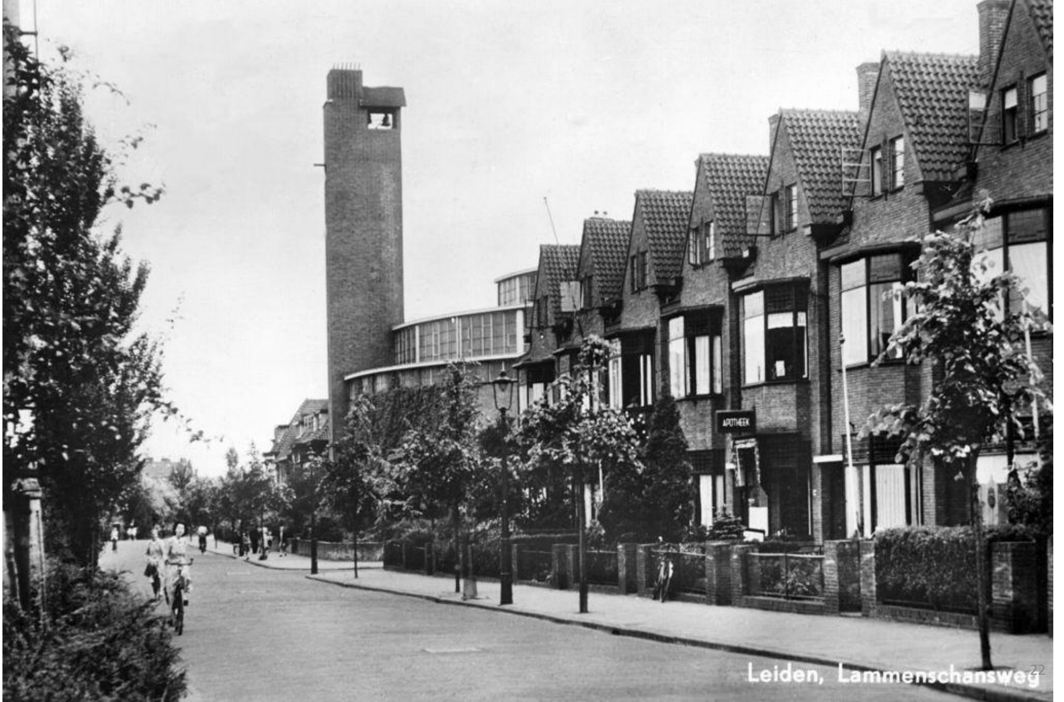
Leiden, Lammenschansweg 22