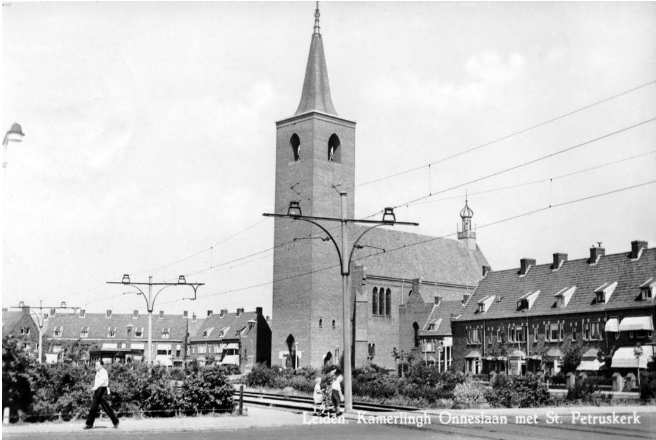
Leiden. Kamerlingh Onneslaan met St. Petruskerk