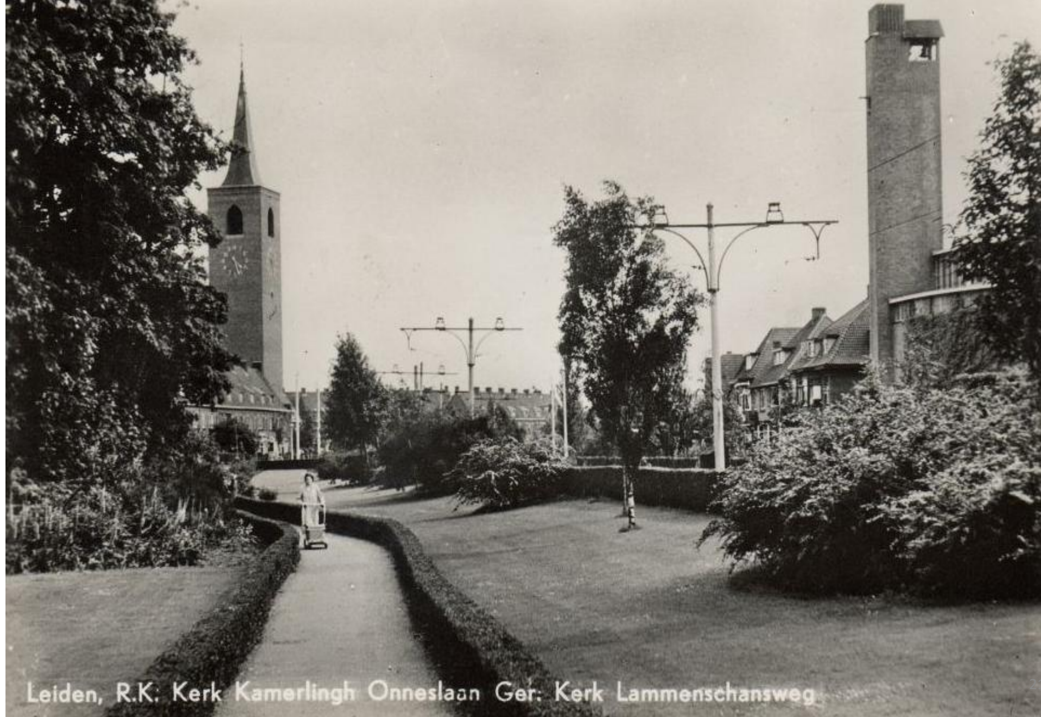
Leiden, R.K. Kerk Kamerlingh Onneslaan Ger. Kerk Lammenschansweg