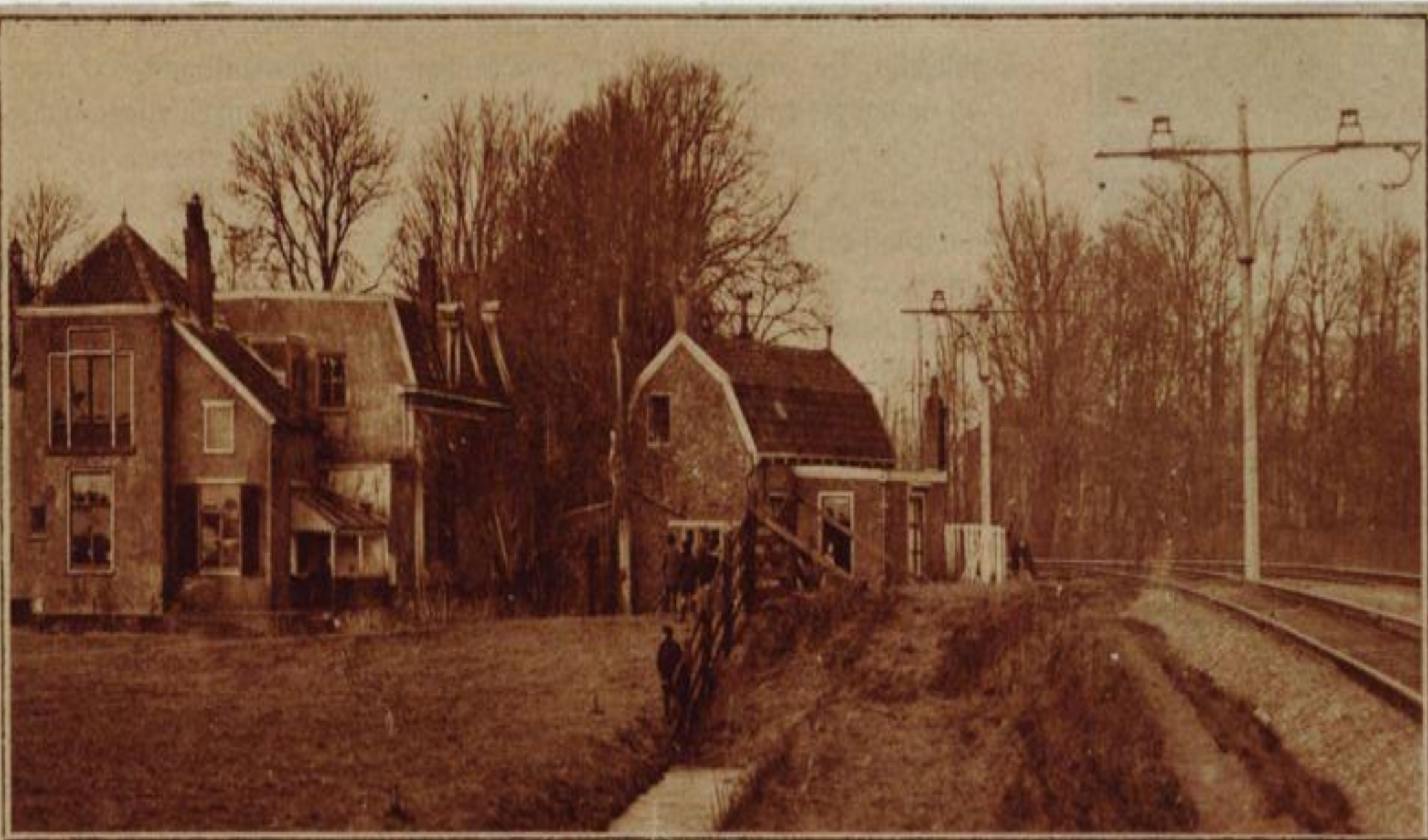
Het zoo knus gelegen, maar versleten Zuiderzicht, in den hoek tusschen Zoeterwoudschen Singel en de tramlijn naar de Residentiebode, wordt afgebroken.