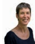
door Marian Rappoldt

mooi is. Zelfs in een kleine groene stadstuin kun je intens genieten van bloemen, planten en al het dierenleven dat zij met zich mee brengen. □