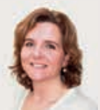
door Maaïke Botden

‘Praten over, of vanuit poppetjes geeft ook een bepaalde mate van veiligheid. Mijn zoontje van zeven speelde laatst toevallig samen met zijn opa met die poppetjes, net zoals ik in mijn praktijk doe. Mijn vader heeft hem wel een uur lang verteld over vroeger en over zijn familie. Ik hoorde dingen die ik zelf nog niet eens over hem wist. Dat is toch prachtig?’ □