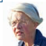
door Rinny E. Kooi

Ik hoop dat iedereen gaat houden van grasstroken die pas worden gemaaid als de bloemen zijn uitgebloeid. Misschien vinden zij ook wel orchideeën. Ook hoop ik dat dit groepje zaden zich kan verspreiden zodat er meer orchideeën in deze grasstrook en elders verschijnen. □