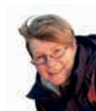
door Nynke Smits

Bent u beeldend kunstenaar of kent u een kunstenaar in onze wijk neem dan alstublieft contact op met: redactie@profburgwijk.nl of 06 - 511 637 80