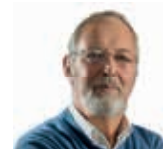
door Rob Beurse

De expositie 'Naar Aanleiding Van...' is te bezoeken in De Arcade, Octavialaan 61 in Leiden (Roomburg). Meer informatie over de studiedagen conceptuele fotografie via info@beursefotografie.nl