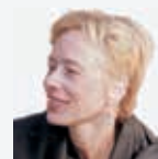
door Marjoleine de Jong

Op het moment van schrijven (augustus) is het voorsnog zo dat de scholen na de zomervakantie weer volledig open kunnen, maar dit blijft onzeker. Daarom werkt de school naast het gewone onderwijsmodel ook andere scenario’s uit: één waar alle leerlingen de lessen thuis digitaal volgen en een tussenvorm, waarbij bijvoorbeeld een deel van de leerlingen op school zit en