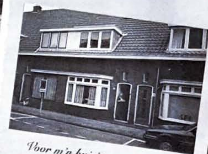
Voor m'n huisje..