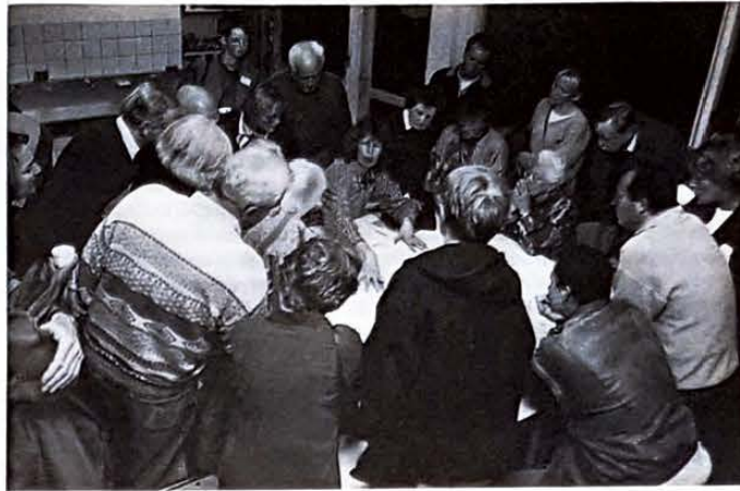
vervolg 'Laat protest tegen JOP'