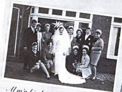
Al m'n kinderen op de foto in de jaren 60.