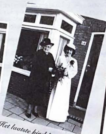
Het laatste kind het huis uit.