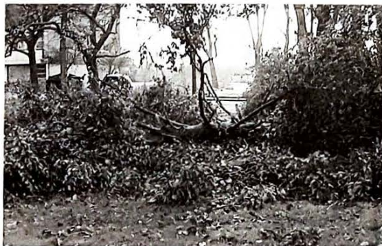
Storm in de wijk