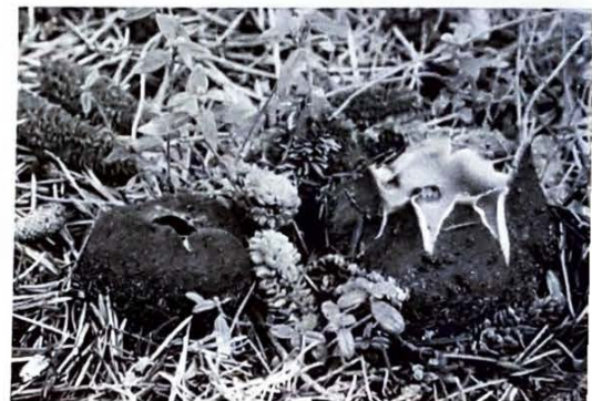
De Cedergrondbekerzwam.