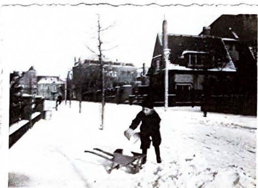
Zoontje van mevrouw Hollebeek in de sneeuw in de P.J. Blokstraat eind jaren dertig, kijkend richting Hoge Rijndijk

De P.C. Blokstraat was volgens mevrouw Hollebeek een sfeervolle straat. “Er stonden roze meidoorns die prachtig bloeiden.” Het ging haar dan ook aan het hart dat iedereen deze