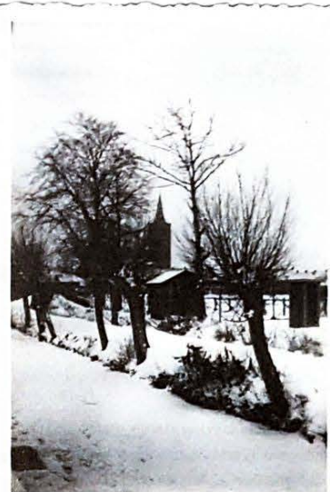
Eind jaren dertig Cronesteynkade kijkend zuidwaarts met Petruskerk

Duitse Landwacht. Op Dolle Dinsdag wilde hij die radio graag mee naar huis nemen. Een collega wist raad. Die had een volkstuin op de plek waar nu de Lorentzschool staat met tabaksplanten. Deze bracht hij altijd weg met een bolderwagen