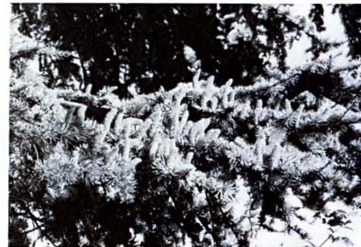
Kaarsjes op een tak.

versierd met natuurlijke kaarsjes. Dat zijn de mannelijke bloeiwijzen die als bruin gele kaarsjes op de takken staan. Begin november lag de grond onder de Ceders bezaaid met "gevalen mannen". De mannelijke bloeiwijze bestaat uit een rechtstaand katje van 3-7 cm. Daarin zit een kern met daarom heen spiraalsgewijs staande schubjes die onder aan twee stuifmeelzakjes hebben. Door de warmte van de zon springen ze open waarna het stuifmeel vrijkomt. De vrouwelijke bloeiwijzen (1 cm lang) zijn onopvallende knopjes. Na de bevruchting groeien deze in twee jaar uit tot eironde en vrij gladde kegels. Aan een centrale as in deze kegel zitten schubben met daartussen zaden aan vleugels voor de verspreiding. Aangezien deze zaden voor dieren lekkere hapjes zijn worden die weinig gevonden. Als in de maand december de kunstkaarsen worden ontstoken kan nog even worden gemijmerd over het feit dat de natuurlijke kaarsjes in de Ceder reeds lang en breed zijn "gedoofd"!