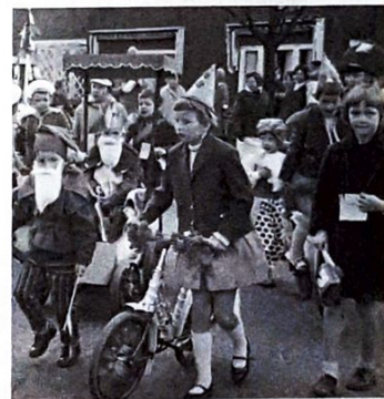
Koninginnedag in de wijk in 2001 (boven) en koninginnedag in de wijk 1962