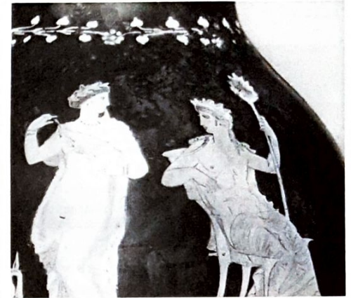
Griekse wijnkaraf uit ca. 350 v. Chr. Rechts Dionysos met een klimopkrans aan een stok.

De oude Grieken beschouwden klimop als een tegengif voor dronkenschap. Het belangrijkste attribuut van Dionysos, de