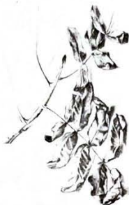
Tekening: Jadranka Njegovan

Iedereen wordt aangeraden eens langs deze Vleugelnoot te wandelen. De fotograaf van de boom bij dit artikel en de schrijfster hebben dat uiteraard ook gedaan. De tuin zelf is nauwelijks te zien omdat deze grotendeels achter een muurtje ligt. Wij zijn zo brutaal geweest op het muurtje te klimmen. Van daaraf hebben wij een blik geworpen in de achtertuin. Deze is enigszins verwaarloosd en daardoor hebben zich rond de Vleugelnoot enkele jongere exemplaren kunnen vestigen "Jonkies van de oudere". Deze bomen zouden kunnen zijn opgegroeid uit nootjes. Het lijkt echter waarschijnlijker dat het uitlopers zijn van de wortels want onder Vleugelnooten wordt vaak een dichte begroeiing aangetroffen: "wortelopslag". Is deze Gewone Vleugelnoot wel zo gewoon? Vorig jaar is een