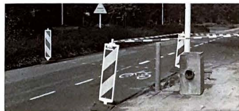
Op de Burggravenlaan zijn kortgeleden dan eindelijk de verbeteringen voor de verkeersveiligheid uitgevoerd.

Wij zijn heel benieuwd of u de (bescheiden) aanpassingen als verbeteringen zult beleven.