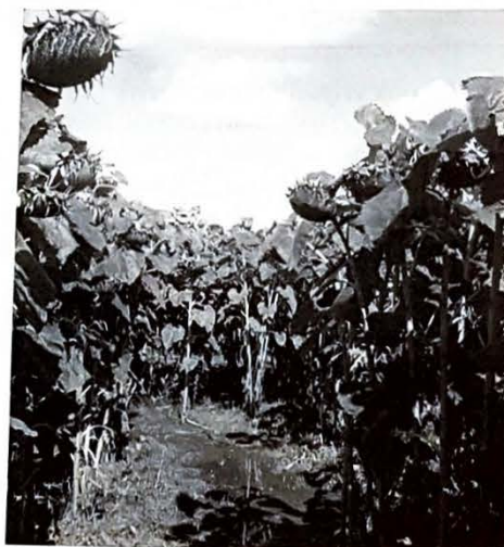
Ook deze zomer is het schitterende doelhof van zonnebloemen in polderpark Cronesteyn weer een groot succes. Bent u al geweest? Het kan nog!