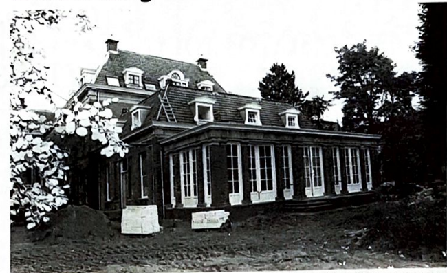
Er wordt hard gewerkt aan de serre en de tuin van het Koninklijk Nederlands Militair Invaliden Tehuis. In de serre komt een verloskundige praktijk en NTN Thuiszorg uit de Raamsteeg zal zich er vestigen.