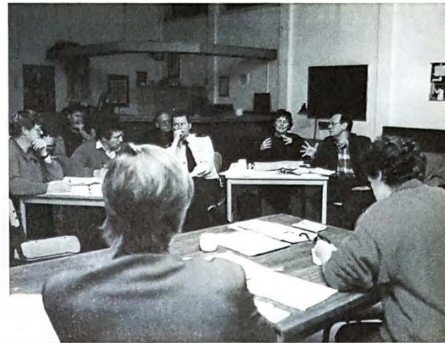
Een delegatie van verschillende gemeentelijke diensten kwam aan de bewoners uitleg geven over de verkeerstechnische mogelijkheden in de wijk.

Ten aanzien van deze doorgangsweg gaat het om verschillende knelpunten. Ten eerste zijn dat de zebra's. Daar spelen drie problemen. De oversteekplaats ter hoogte van de Oppenheimstraat moet verlegd worden voor de oversteekende schoolkinderen. Dit was al enige tijd geleden toegezegd aan de klaar- overs; er was zelfs al financiering voor gevonden. Vervolgens gaat het om de oversteekplaats ter hoogte van de Lorentzkade: deze is vanuit het noorden benaderd slecht zichtbaar voor automobilisten en vice versa. Dit komt door de Lorentzbrug. Verplaatsing blijkt moeilijk. Daarom hebben we aandacht gevraagd voor zichtbaarheid met waarschuwingsborden en (portaal)verlichting. Ook moeten de stoepranden in de middenberm verlaagd worden, zodat rolstoelgebruikers en kinderwagens