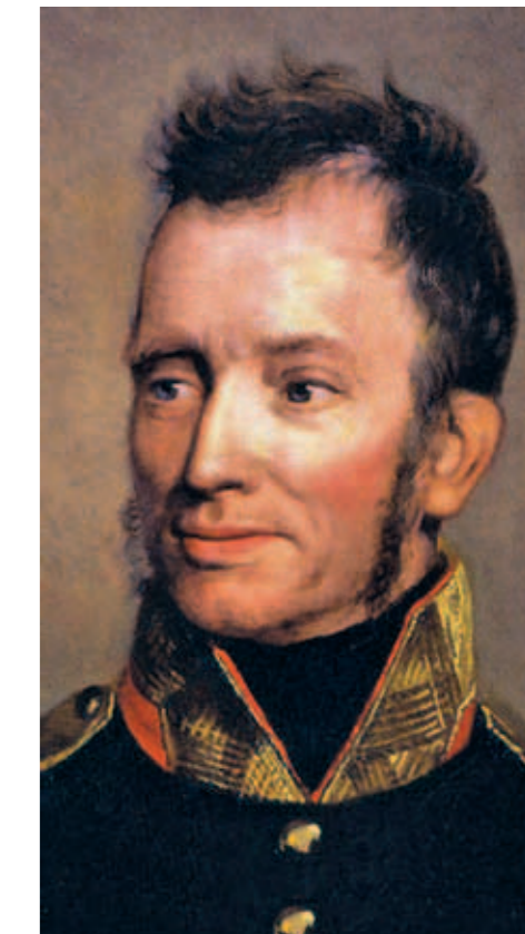
▪ Burgemeester Koning Willem I.