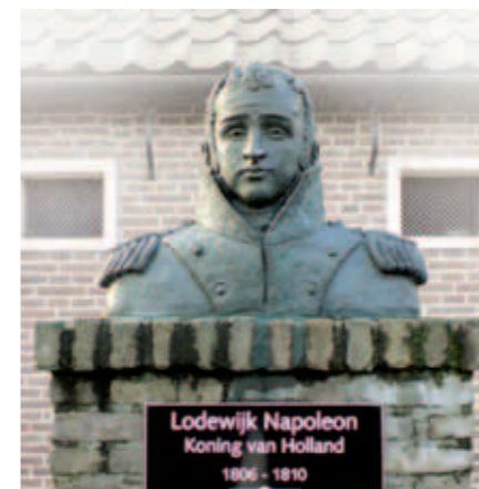
▪ Burgemeester Lodewijk Napoleon – de broer van...