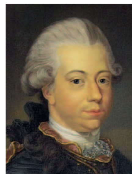
▪ Burgemeester Stadhouders Willem V.

Na de roerige Franse tijd (gekenmerkt door een fluwelen revolutie, zonder enig bloedvergieten), die eindigt in 1813 als Napoleon uiteindelijk verslagen is, begint een nieuwe tijd die op z'n minst net zo roerig te noemen is en waarin de moderne monarchie gestalte krijgt met de