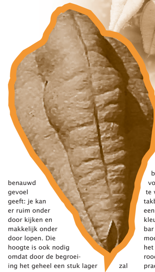
• De zaaddozen van Koelreuteria paniculata .

Pergola's zijn oorspronkelijk afkomstig uit het Middellandse Zeegebied. Begroeid met druiven zorgen ze daar voor prettige zitplekken in de schaduw. Ook in onze tuinen kunnen pergola's goed gebruikt worden om een terras te overkappen en zo de zitplek een plafond te geven. Pergola's of colonnades (een enkele rij palen met een ligger erop) dienen ook om verschillende tuindelen met elkaar te verbinden, of om de overgang van het ene tuindeel naar het andere te markeren. In een lange smalle tuin kan een in de breedte geplaatste pergola of colonnade de lengte van de tuin doorbreken. Als de constructie stevig genoeg is kan er ook nog een schommel aan worden gehangen. Plaats een pergola nooit zomaar ergens in de tuin: er moet altijd een verband zijn met het huis of eventueel de schuur. Een mooie hoogte voor een pergola is 2,5 meter. De hoogte van de tuin wordt er door begrensd, maar zonder dat het een