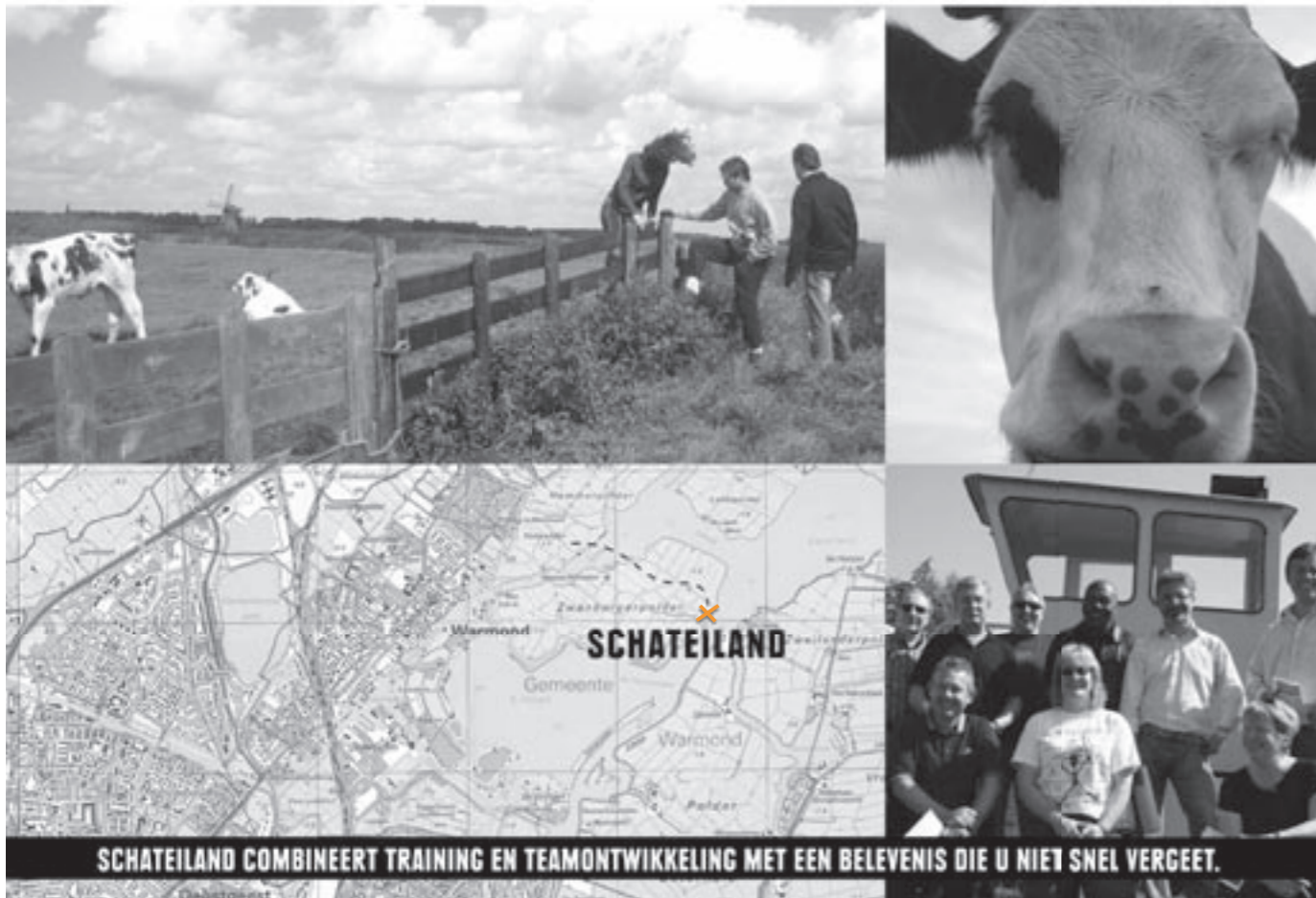
SCHATEILAND COMBINEERT TRAINING EN TEAMONTWIKKELING MET EEN BELEVENIS DIE U NIET SNEL VERGEET.

Wilt u meer weten? Bel 06 33834091 of kijk op www.schateiland.com