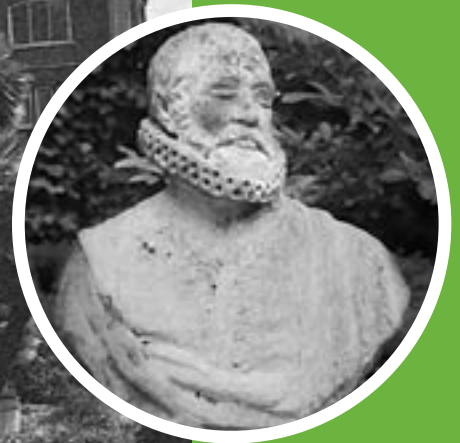
▪ Borstbeeld professor Clusius.

De eerste grote naam die aan de Hortus verbonden was, was die van Carolus Clusius. Hij was de eerste Praefectus Horti. Van uitbreiding van de Hortus was pas echt sprake toen in 1670 het eerste pandje achter de Doelengracht werd aangekocht. Ook tijdens het directoraat van Herman Boerhaave werden enkele uitbreidingen gerealiseerd. In 1732 nam Adriaan van Royen het directeurschap op zich waarna in 1736 de Hortus een flink stuk groter werd. De Hortus is op zijn grootst als in 1818 het gehele stuk grond tussen de Cellebroersgracht (Kaiserstraat), Doelengracht en de Witte Singel tot botanisch grondgebied geworden is. Na de bouw van de Sterrenwacht is de Hortus qua grondgebied niet meer veranderd, behalve dat aan de overzijde van de 1ste Binnenvestgracht de bovengenoemde