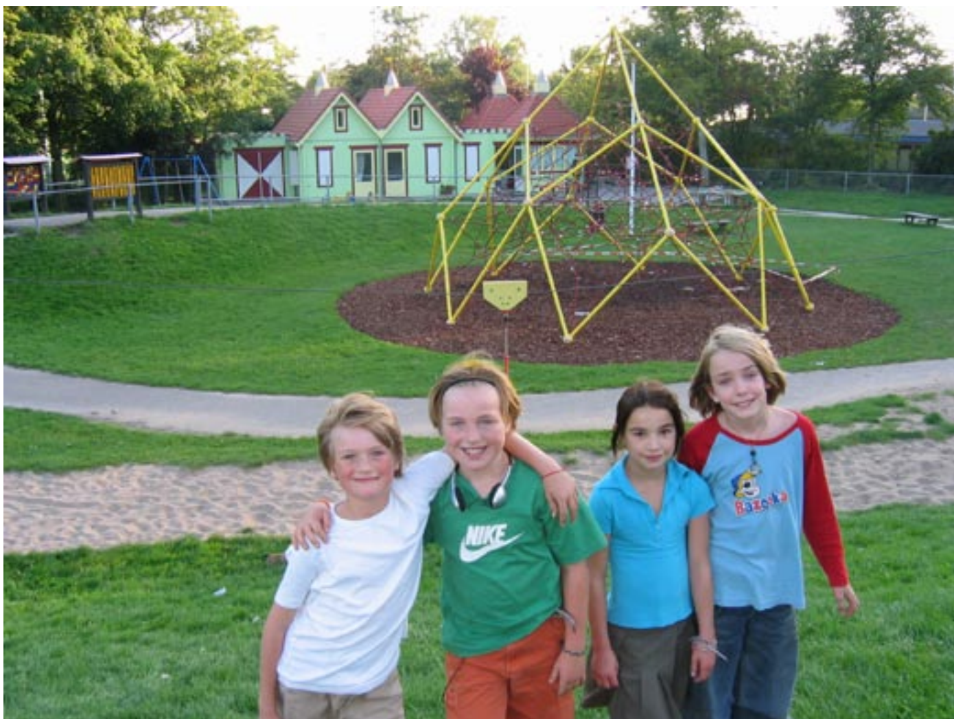
Het veelbesproken gebouwtje in Speeltuin De Speelschans is op 10 juni geopend. Het is het nieuwe onderkomen voor buitenschoolse opvang 't Kasteel en het nieuwe clubhuis voor de speeltuinvereniging.