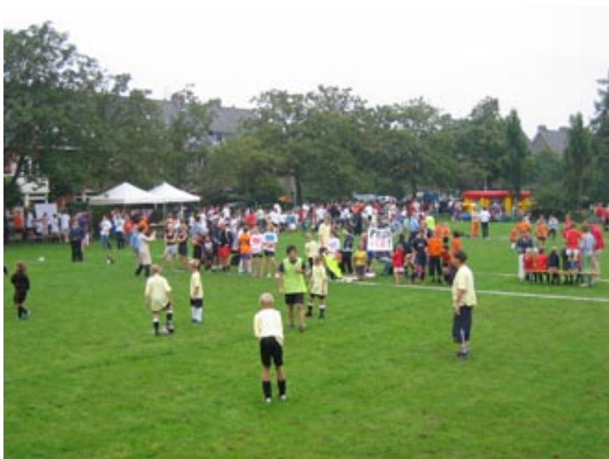
Burgerbal 2006: op zondag 17 september was het weer zo- ver. De temperatuur was gezakt, lekker voor de tientallen voetballertjes en voetballers. Kleurrijk, gezellig en fana- tiek, zo was de geweldige sfeer.