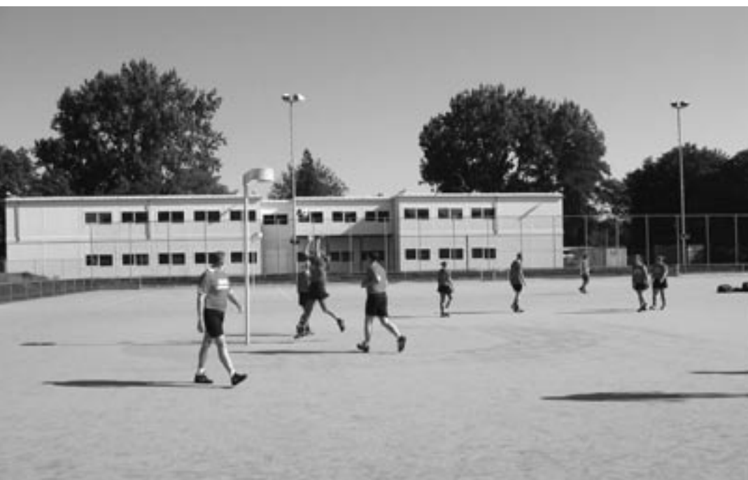
De noodlokalen van de Lorentzschool naast Sporting Trigon