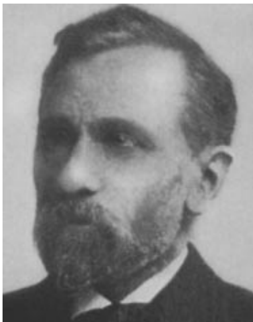
Hendrik Willem Bakhuis Roozeboom

Zij kregen zes nakomelingen: vier zoons, twee dochters. 1 mei 1882 legt Bakhuis Roozeboom zijn doctoraal examen af. Inmiddels is hij dan al een jaar leraar aan de Gemeentelijke HBS voor meisjes te Leiden. Op de Leidse Garenmarkt staat nog altijd het prachtige gebouw van deze voormalige HBS, later bekend als de 'Louise de Coligny' (zie kader).