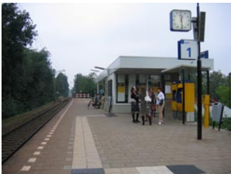
Een avondwinkelaar in het stationsgebouwtje Lammenschans? Iemand schijnt dat plan te hebben.