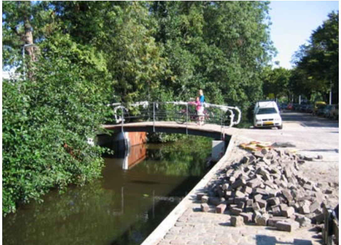
Het nieuwe bruggetje aan de Cronesteynkade

Net als de schooldirectie is het bestuur van de wijkvereniging niet gelukkig met de bouw in fases, waardoor de leerlingen worden verdeeld over twee locaties en er diverse verhuizingen nodig zijn. Directeur Renate de Vries: “Natuurlijk hadden we het hele proces graag simpel gehouden, bijvoorbeeld door een