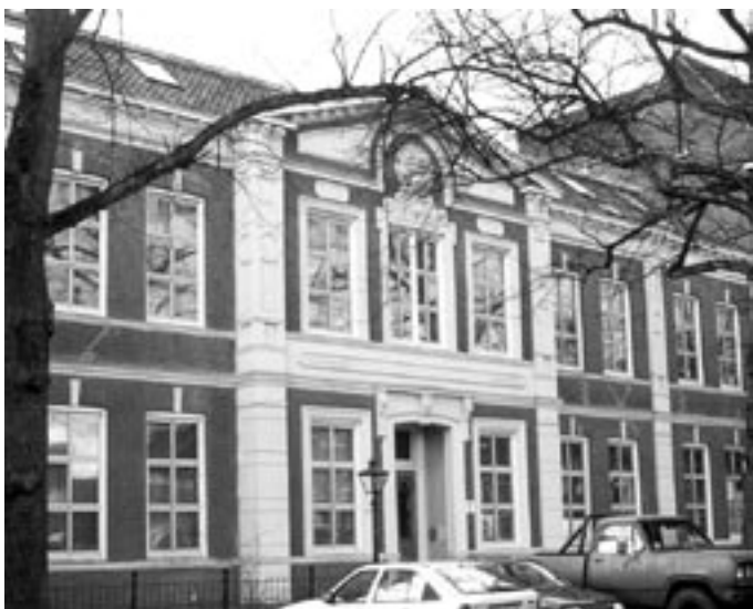
HBS Garenmarkt, hier gaf Bakhuis Roozeboom les

hij het idee op om zijn onderzoeken met betrekking tot de fasenleer en zijn chemische toepassingen te publiceren. Bakhuis Roozeboom was een man die veel waarde aan zijn geloof hechtte en hoewel in die tijd de 'moderne wetenschap' en het geloof niet bepaald hand in hand gingen, wist hij beide met elkaar te combineren door de oprichting in 1895 van de Christelijke Vereeniging van Natuur- en Geneeskundigen. Bui-