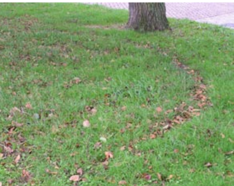
In het gras onder de els bij het bruggetje groeit al een aantal jaren een heksenkring met een diameter van ongeveer drie meter

groeien er dan in de toekomst wel moerasorchideeën langs de oever.