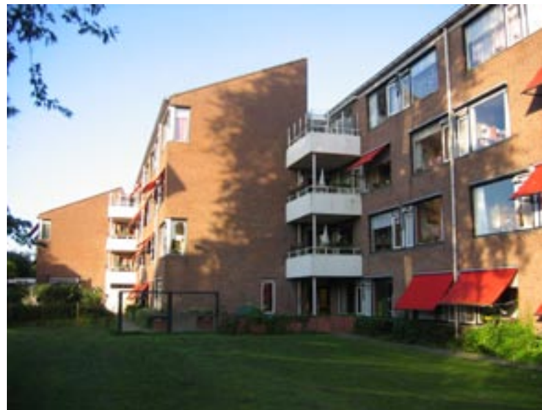
Zorgcentrum Lorentzhof krijgt nieuw onderkomen in groot project

Het grootste bouwproject in onze wijk zal de komende tijd de nieuwbouw van zorgcentrum Lorentzhof zijn, in combinatie met woningen en een dienstencentrum. Dit voornemen draagt de wijkvereniging een warm hart toe. Kritische opmerkingen zijn echter geplaatst bij de hoge bebouwingsgraad van 65%.