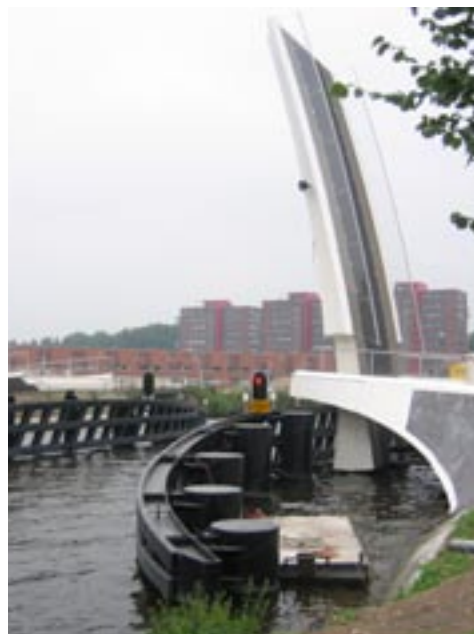
De opening van de nieuwe voetgangers- en fietsersbrug over het Rijn- Schiekanaal was gepland voor vrijdag 15 september. Op de valreep ble- ken de papieren niet in orde. Dus de festiviteiten zijn uitgesteld.