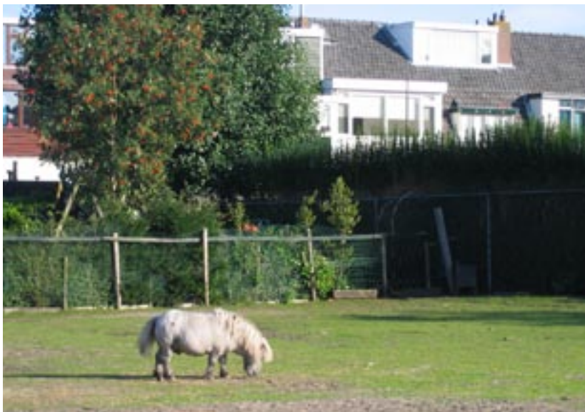
Weide Verdamstraat: straks volgebouwd?

Tot slot uit het bestuur haar verbazing over de oostelijke grens van het beschermd stadsgezicht. Deze grens is de Burggravenlaan en de direct aangelegen wo-