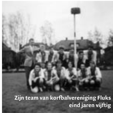
Zijn team van korfbalvereniging Fluks eind jaren vijftig