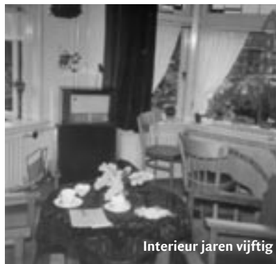
Interieur jaren vijftig