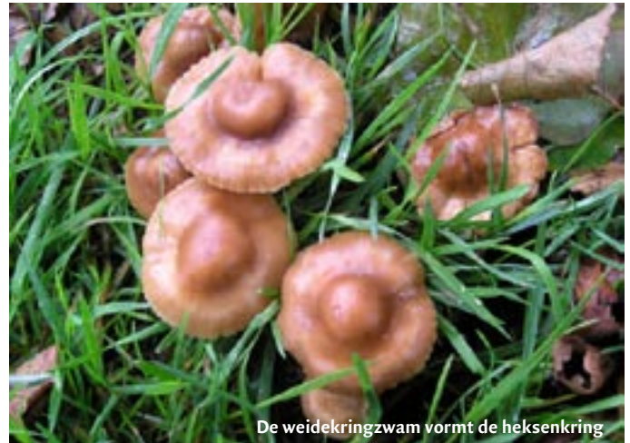
De weidekringzwam vormt de heksenkring

In april 2006 zijn meer natuurlijke oevers in de vorm van drasbermen aangelegd. Die drasbermen hebben een waterzuiverend effect. Ook komen daardoor de resten van hondenpoep minder snel in het water. Daarnaast is de doorstroming van