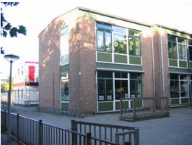
De Josephschool heeft nu al noodlokalen. Straks nieuwbouw?

Behalve voor de Lorentzschool wordt in dit bestemmingsplan ook voor de Josephschool nieuwbouw mogelijk gemaakt. Het bestuur reageert: "Behalve dat dit nieuw is en het onduidelijk blijft hoe groot een nieuwe school mag worden, is het opvallend dat de gemeente een bebouwing wil toe staan van dat 'scholengebied' aan de Oppenheimstraat van maar liefst 75%! En dat terwijl buitenspeelruimte hier cruciaal is voor de schoolkinderen en de kinderopvang. Net als in het nieuwbouwproject Lorentzschool wil de gemeente ook hier woningen toevoegen." Tegen beide zaken verzet de wijkvereniging zich.