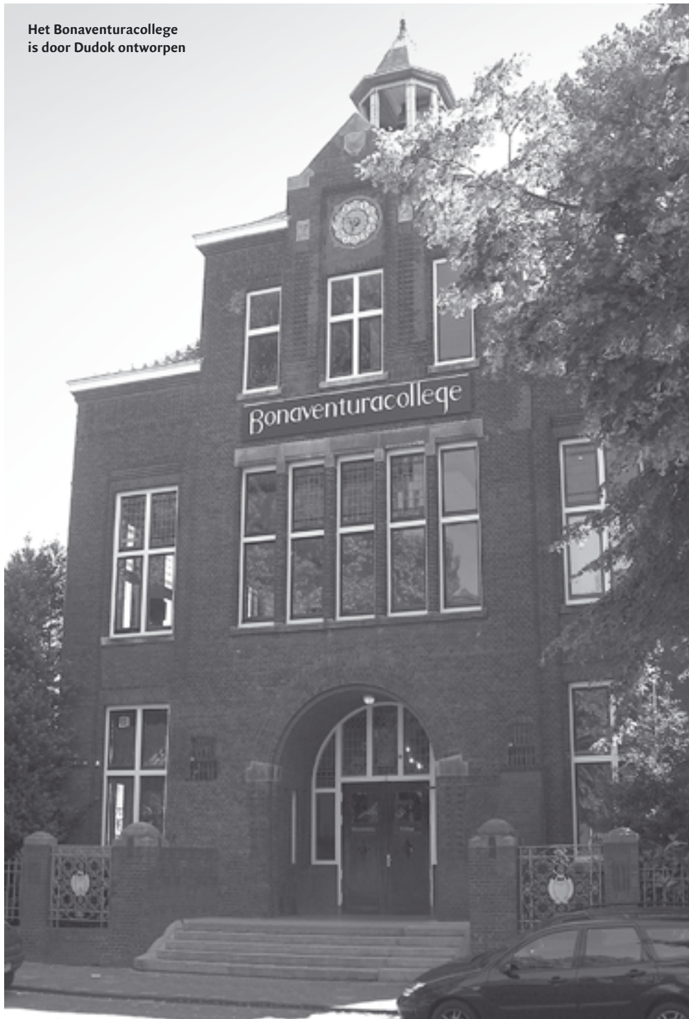
Het Bonaventuracollege is door Dudok ontworpen

Rond de laatste eeuwwisseling werd een nieuw gedeelte - met loopbrug verbonden aan het oude deel - in gebruik genomen om de immer groeiende stroom leerlingen met moderne middelen te kunnen blijven onderwijzen. Dat het nieuwe deel niet echt past bij het statige Dudok-gebouw was waarschijnlijk niet van belang; functioneel moest het