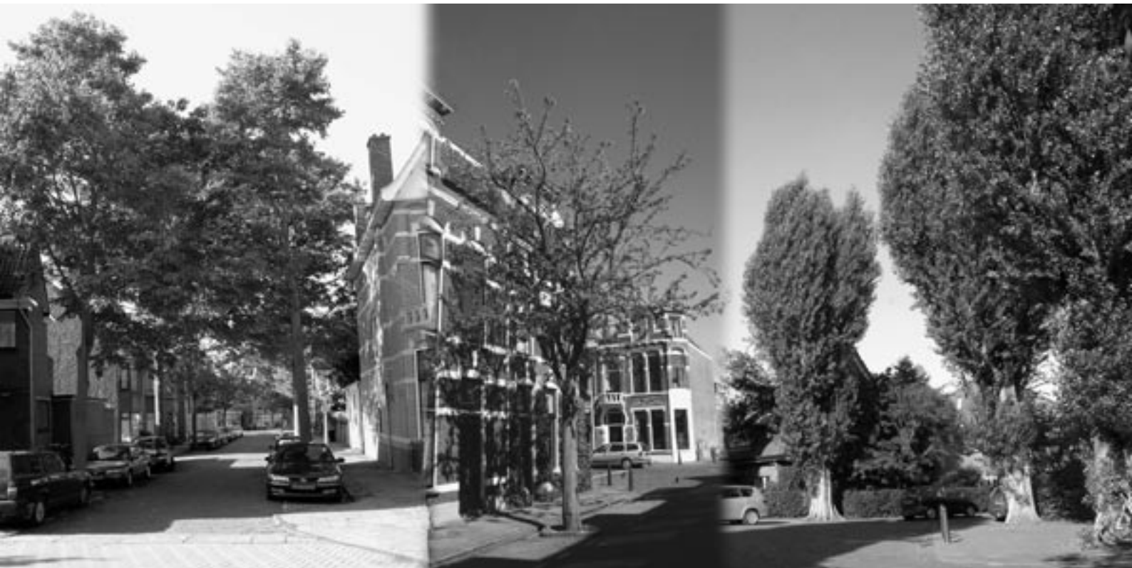
Bomen in de eerst aangelegde straat van de wijk: hoe oud zijn ze nou eigenlijk?

trek is gemiddeld 287 cm. Honderd jaar worden ze niet want er zijn al plannen om ze te kappen. Gezien de levensverwachting van populieren verwacht ik ook niet dat de jubileumboom er nog is als gevierd wordt dat de wijk tweehonderd jaar bestaat. Daarom verwacht ik dat ook de nieuwe herdenkingsboom al verdwenen zal zijn als gevierd wordt dat de wijk tweehonderd jaar bestaat, mogelijk zelfs al als de wijk 150 jaar oud is. De