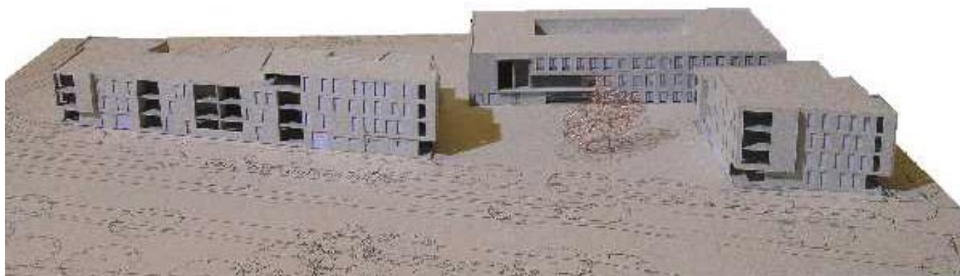
Het nieuwe schoolgebouw gezien vanaf de Van Vollenhovenkade, met links en rechts de woonblokken

Als alles volgens plan verloopt, zal aan het einde van 2006 begonnen worden met de sloop van de helft van de huidige Lo-