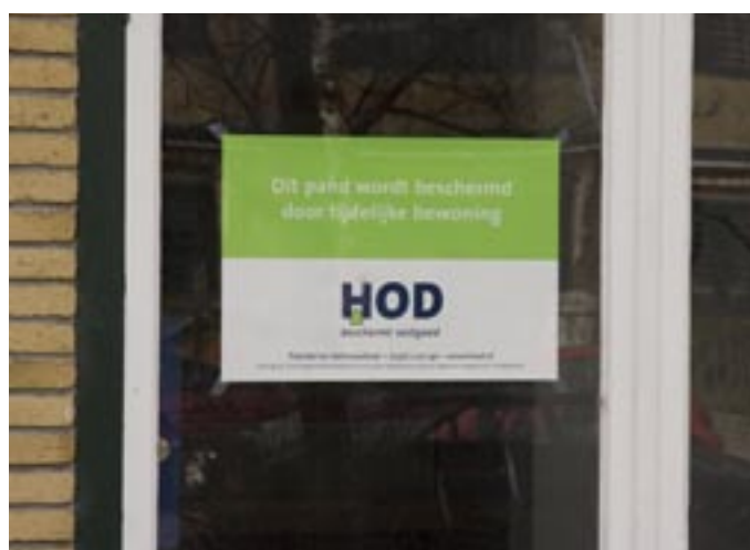
Op dit moment bewonen anti-krakers het pand