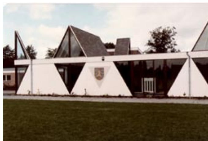
Het oude clubhuis van Roomburg met de opvallende puntconstructie, die later veel lekkages bleek te veroorzaken. Let op het echte gras in plaats van kunstgras!