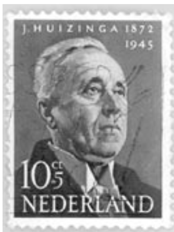
In de door de PTT '54 uitgegeven serie zomerzegels vertegenwoordigde Huizinga een waarde van 15 cent