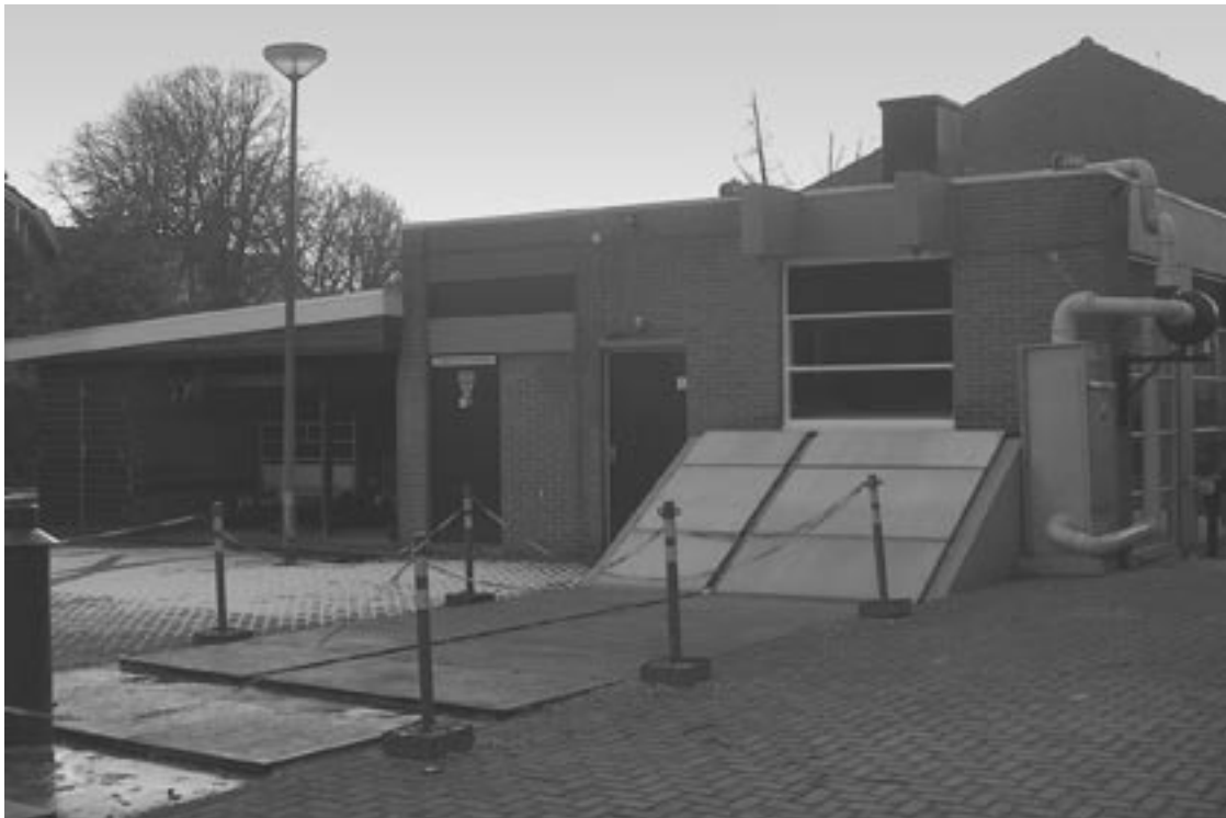
Het rioolgemaal pompt het rioolafvalwater met een capaciteit van gemiddeld 1200 kuub per uur door een 100 cm dikke pijp naar de waterzuiveringsinstallatie aan de Voorschoterweg

Omdat mensen tegenwoordig hun chemisch afval niet meer lozen, is het afvalwater dat gezuiverd moet worden vrij 'schoon' te noemen. Rest dan nog de stank, die overigens erg meevalt als je je bedenkt wat daar beneden allemaal gebeurt. Die stank wordt met behulp van filters en toevoegingen bijna geheel onderdrukt.