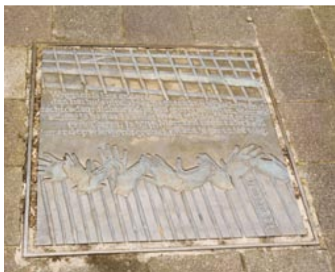
Deze gedenksteen voor de weggevoerde kinderen zou moeten worden aangevuld met een volwaardig monument