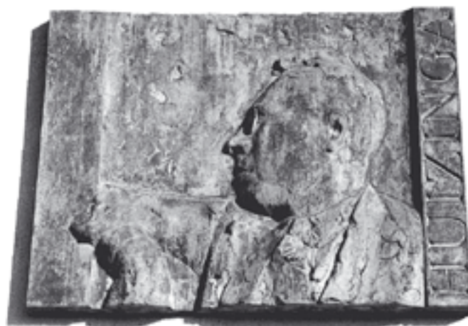
Plaquette met de beeltenis van Huizinga op het complex aan de Witte Singel