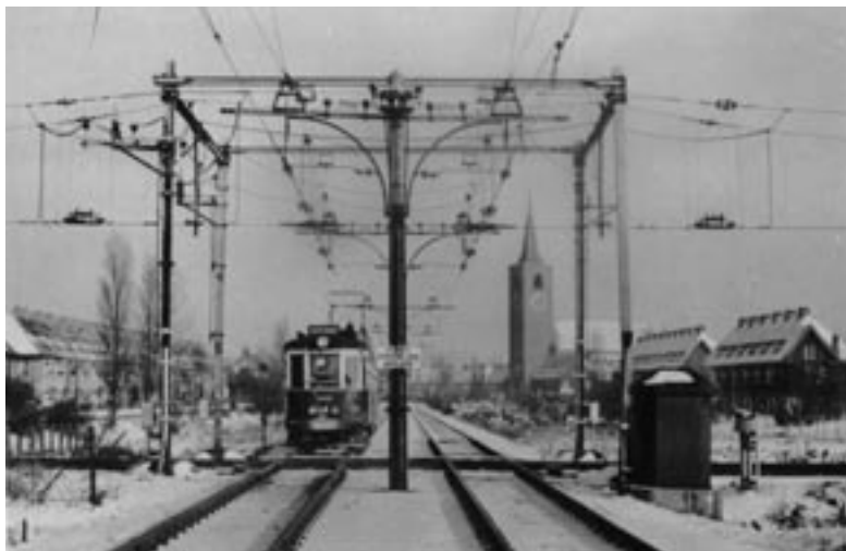
Winter 1955: tram naar Den Haag op de Lammenschansweg kruist spoorlijn gelijkvloers

In 1935 waren de Petruskerk en de huizen achter hun huis net in aanbouw. “Van de Petruskerk stond de toren er al. Aan de rest waren ze nog bezig. Mijn broer en ik traptten altijd een balletje tegen de muren van de kerk. Veel vertier voor kinderen was er nog niet. Er waren natuurlijk nog niet zoveel kinderen in de buurt en ook nog geen scholen. Wel speelden we wegkruipertje in de huizen die in aanbouw waren en ik speelde vaak voor de deur met mijn Vliegende Hollander.” Zijn ouders hadden niet zoveel contacten in de buurt, alleen met familie die aan