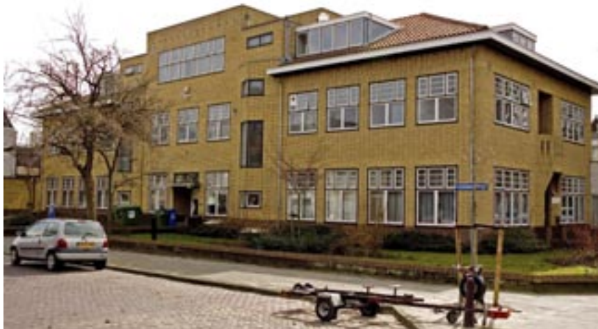
Het voormalige GGD-gebouw in de Rodenburgstraat

Een van de mogelijke, gedeeltelijke, invullingen van de lege ruimte is uitbreiding van Psycho-Medisch Centrum Parnassia. Op dit moment is aan de zijkant