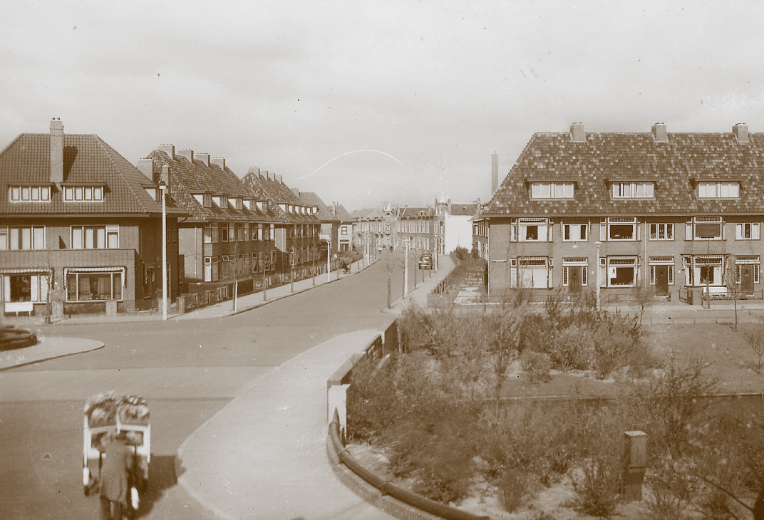
50 jaar geleden: bloemenman onderweg naar Burgemeesterswijk