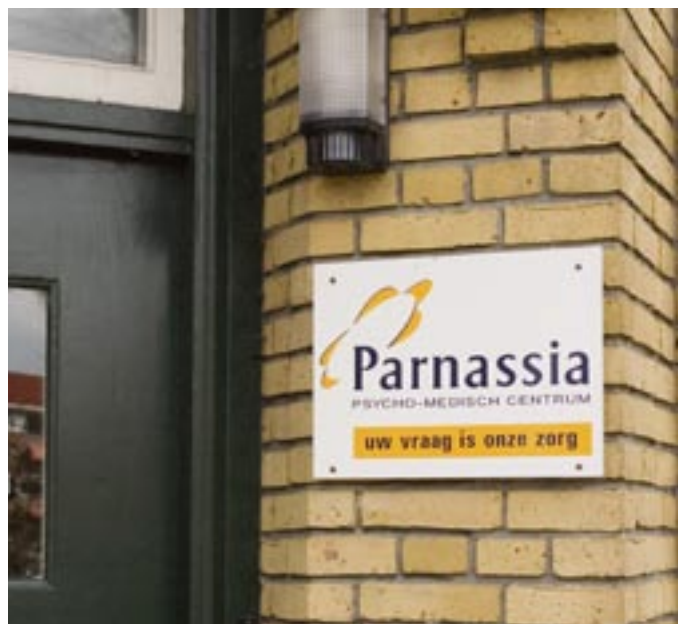
Parnassia wil zijn activiteiten in het gebouw uitbreiden