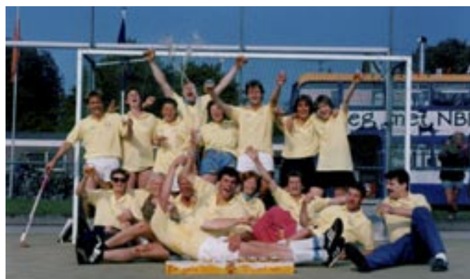
Vijfvoudig PIM's winnaar DGM na de gewonnen finale in 1986

De dertigste editie van het PIM's toernooi belooft dit jaar extra feestelijk te worden. Met ruim zeshonderd spelende bezoekers is dit het grootste mixed toernooi van Nederland. Voor de juniorteams van LHC Roomburg worden eind mei allerlei activiteiten georganiseerd.