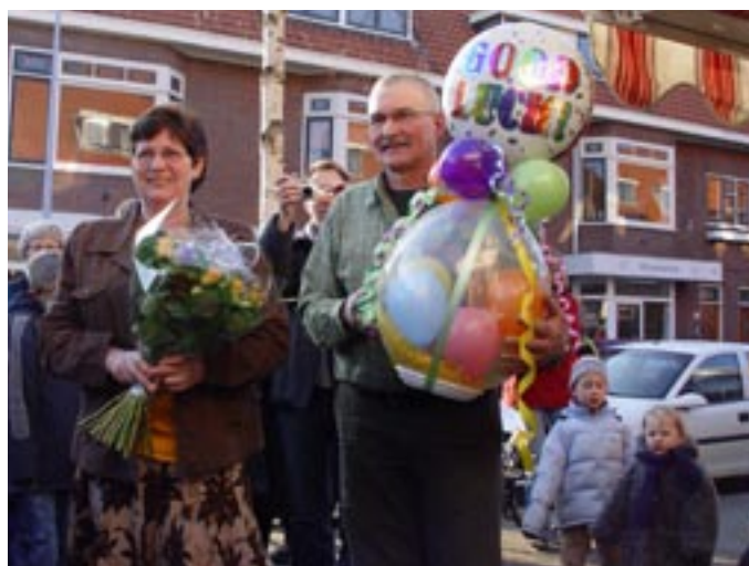
Euro's verpakt in ballonnen