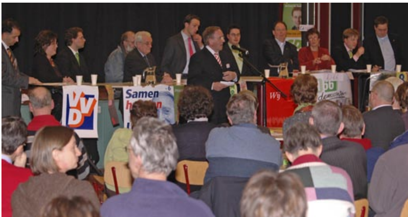
De wijkvereniging had de politieke partijen uitgenodigd om te komen debatteren in de wijk. Deze avond vond plaats op 6 maart in het gymnasiumgebouw.

Als we de uitslag van de verkiezingen – voor zover dat mogelijk is - vergelijken met de peiling tijdens onze eigen verkiezingsavond op 6 maart in de wijk zien het volgende. Christenunie (24,8%), CDA (24%) en SP (17%) waren daar in de slotstemming de sterkste partijen met op grote afstand de andere partijen. De PvdA had uiteindelijk nauwelijks aanhang en aanhangers van CDA en Christenunie waren kennelijk oververtegenwoordigd onder de aanwezigen. Desalniettemin bevestigde de grote opkomst tijdens de verkiezingsavond die georganiseerd werd door de wijkvereniging, dat de betrokkenheid bij lokale en zelfs wijkgerelateerde problemen een grote invloed kunnen hebben op de aanwezigheid bij een verkiezingsavond en op het stemgedrag in het stemhokje.