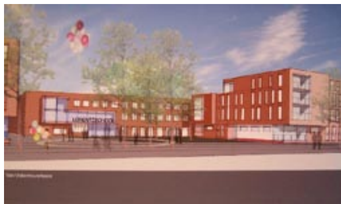
Een impressie van de nieuwe situatie, gezien vanaf de Van Vollenhovekade

Atelier PRO heeft een ontwerp gemaakt voor de nieuwe school aan de Van Vollenhovekade. Het gebouw van drie verdiepingen bestaat uit 38 lokalen, een gymzaal en een peuterspeelzaal met mogelijkheden voor BSO (buitenschoolse opvang). Om zo'n grote school het gevoel van kleinschaligheid te geven, hebben de architecten de verdiepingen toebedeeld aan de verschillende leeftijdsgroepen. Op de begane grond komen de kleuterklassen, de onderbouw zit op de eerste verdieping en de tweede verdieping is gereserveerd voor de bovenbouw, de oudste leerlingen. Het hart van de school wordt gevormd door de gymzaal, die ook dienst doet als aula. Verticaal is het gebouw verdeeld in vier huizen, die de thema's aarde, vuur, water en lucht kregen. Die indeling in zowel huizen en verdiepingen klinkt wat ingewikkeld, maar het zorgt ervoor dat leerlingen van dezelfde leeftijd bij elkaar zitten aan één gang. Bijvoorbeeld: vier kleutergroepen zitten naast elkaar in huis Aarde op de begane grond. Voor leerlingen blijft de grote school zo toch overzichtelijk. En om de grote stroom leerlingen 's ochtends en 's middags goed te kunnen verwerken, heeft de school drie ingangen.