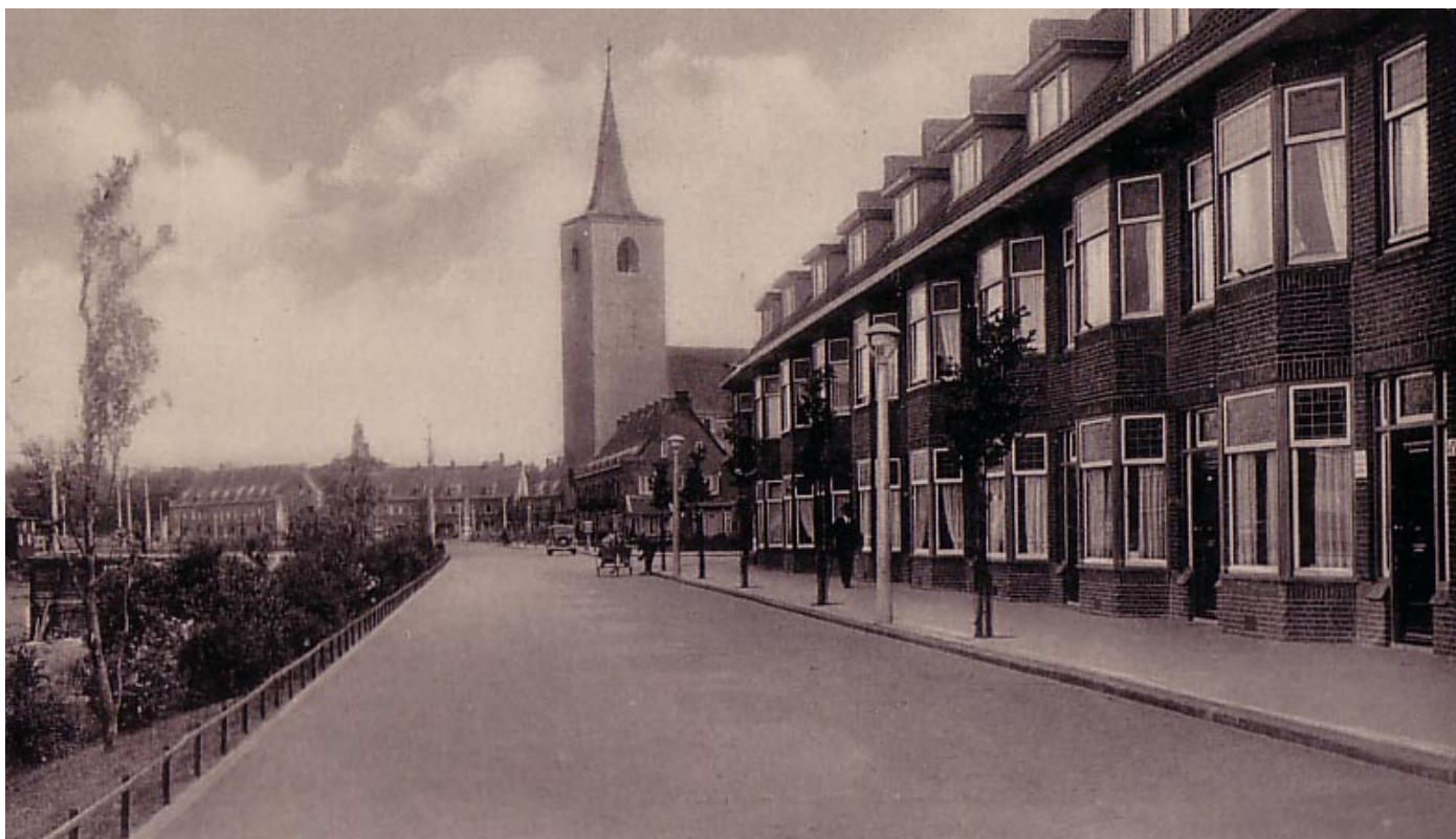
Kamerlingh Onneslaan 1935