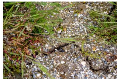
Voedrijken kunnen door de droogte sneller krimpen en barsten dan andere dijken.