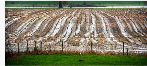
▲ Na extreem droge zomers, zijn de akkers en weilanden nu extreem drassig.